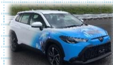
水素エンジン車両